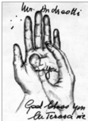
Nel centenario della nascita di Giulio Andreotti