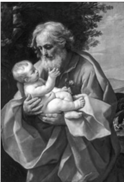
Guido Reni, «San Giuseppe e il bambino Gesù» (1635)

di noi e di come siamo fatti? La fraternità si presenta anzitutto come un principio di realtà: possiamo scegliere i nostri amici, la sposa o lo sposo, ma non i fratelli e le sorelle: non sono autore della loro esistenza e non ne posso disporre. Essi sussistono accanto a me, uguali in valore umano, dignità e diritti. Ma la fraternità è allo stesso tempo principio di differenza, poiché non esiste un fratello uguale all'altro: l'uguaglianza, tra fratelli e sorelle, consiste nella possibilità di essere, ciascuno e ciascuna, liberi nella propria diversità. La fraternità spiega dunque il modo con il quale l'essere umano è, e con il qua-