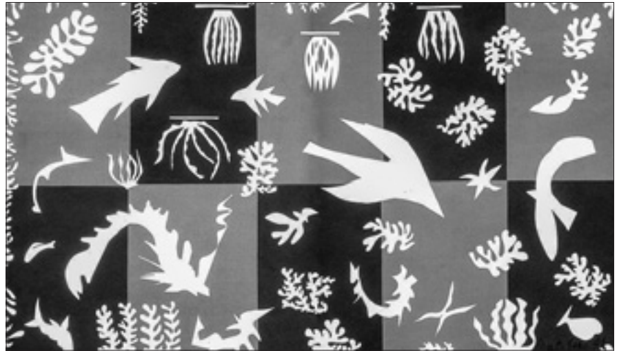
Henri Matisse «Polinesia» (1947, particolare)

so dell'umano – l'unità tra l'uomo e la donna –, la prima struttura ingiusta.