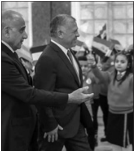
Il premier iracheno Maliki insieme al sovrano giordano a Baghdad

AMMAN, 15. Re Abdallah II di Giordania si è recato ieri a Baghdad, a oltre dieci anni dal suo ultimo viaggio ufficiale in Iraq. I media iracheni danno ampio spazio all'incontro che il sovrano giordano ha avuto con il presidente iracheno, Barham Salih. I due leader hanno discusso di questioni bilaterali politiche ed economiche.