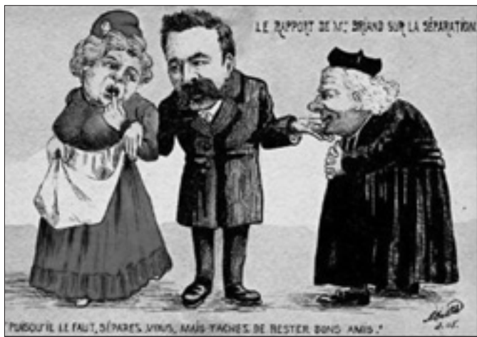
La separazione fra lo Stato e la Chiesa in una caricatura dell'epoca

dell'islam, senza tuttavia toccare i grandi principi della legge. Dopo i tragici attentati terroristici che a più riprese hanno colpito la Francia, è sorta la necessità di porre una decisa barriera agli estremismi islamici, ai discorsi di incitamento all'odio pronunciati nelle moschee, ai sovvenzionamenti "sospetti" provenienti da nazioni dove resta forte il fondamentalismo. In un paese dove vive la più grande comunità musulmana d'Europa - circa 5 milioni di persone - lo Stato vuole vederci chiaro sulla qualità della formazione degli imam, sull'affidabilità della dirigenza delle associazioni culturali (la maggior parte delle quali istituite secondo una legge datata 1901), sui fondi che le sostengono, promuovendo e favorendo la parte sana ovvero la stragrande maggioranza della popolazione musulmana, garanzia anche di vigilanza sulla comunità. Macron vuole limitare i finanziamenti esteri - Algeria, Marocco, Turchia ma anche Arabia Saudita finanziano la costruzione di moschee e la gestione delle associazioni - per aiutare invece a emergere investitori interni, più controllabili, senza escludere in cambio maggiore autonomia nei profitti legati per esempio ai beni immobiliari. L'intenzione, su questo il presidente della Repubblica è stato chiaro, non