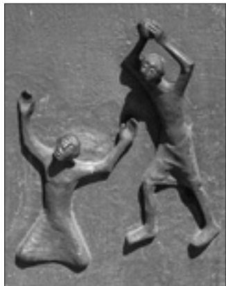
Ananimo, «Caino e Abele» (2017)

più frequentemente, anticlericali. Ma nella sua sostanza, nel suo significato duraturo, esso è la progressiva acquisizione, da parte dell'umanità, dei doni che le religioni portano in sé. Alla fraternità viene spesso obiettato di essere un principio religioso e, per questo, non adatto a venire utilizzato nella sfera civile e politica. A questa obiezione si risponde facilmente: non solo la fraternità, ma tutti i grandi principi antropologici e relazionali delle diverse civiltà iniziano la loro storia dai racconti originali, appartenenti alla sfera religiosa. In molti di questi