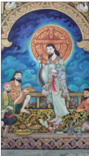
Tigermynou, «L'ultima cena» (particolare, arte tha)