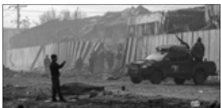
Il luogo dell'attentato a Kabul

un'auto nella zona est della città. Secondo un bilancio dell'agenzia Dpa, lo scorso anno a Kabul sono stati perpetrati 24 attacchi terroristici, che hanno provocato 536 morti e oltre mille feriti.