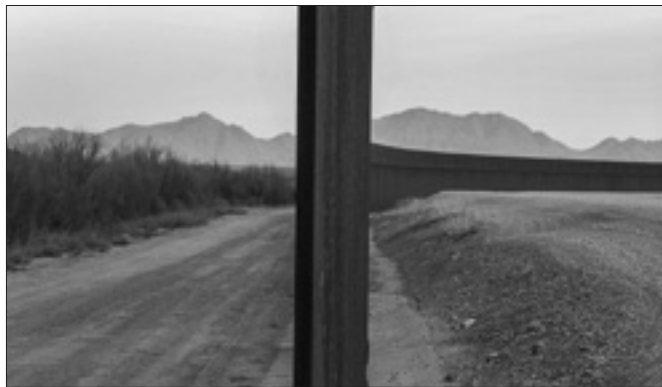
I militari statunitensi resteranno ancora per mesi al confine con il Messico

Trump ed Erdoğan discutono della possibilità di una "zona cuscinetto" nel nord