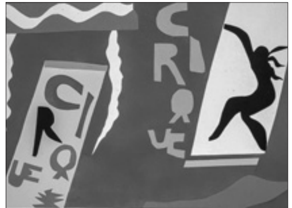
Henri Matisse, «Il circo» (1943, particolare)

racconti incontriamo anche alcuni nuclei concettuali, spesso frutto di tradizioni più recenti e culturalmente più evolute, che si inseriscono dentro un patrimonio antico, tramandato, dapprima, oralmente; un caso molto conosciuto, per fare un esempio, è quello dei racconti della creazione dell'uomo e della donna nel libro della Genesi . Queste prime narrazioni religiose danno vita a diverse culture, alle quali trasmettono interpretazioni della fraternità, della libertà, dell'uguaglianza o disuguaglianza degli esseri umani, dell'autorità, della relazione uomo-donna, ecc., che le culture successivamente elaborano e, spesso, arrivano a separare dalla radice religiosa originaria. L'obiezione contro la fraternità