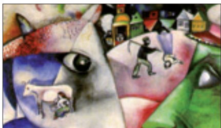
Marc Chagall, «Io e il mio villaggio» (1911, particolare)