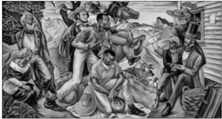
Hale Woodruff, «The Underground Railroad» (1942, particolare)