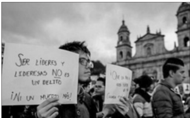
Allarme della Chiesa colombiana per l'uccisione di leader e attivisti