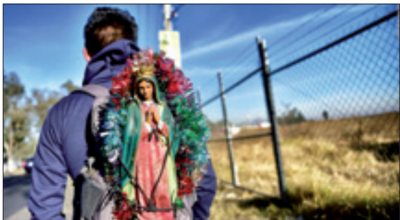
Pellegrino con sulle spalle l'immagine della Vergine di Guadalupe

Domenica 20 gennaio il cardinale Giovanni Angelo Becciu, prefetto della Congregazione delle cause dei santi, prenderà possesso della diaconia di San Lino. Ne dà notizia l'Ufficio delle celebrazioni liturgiche del Sommo Pontefice, specificando che il porporato si recherà alle 11.30 nella chiesa romana di via Cardinale Garampi, 60.