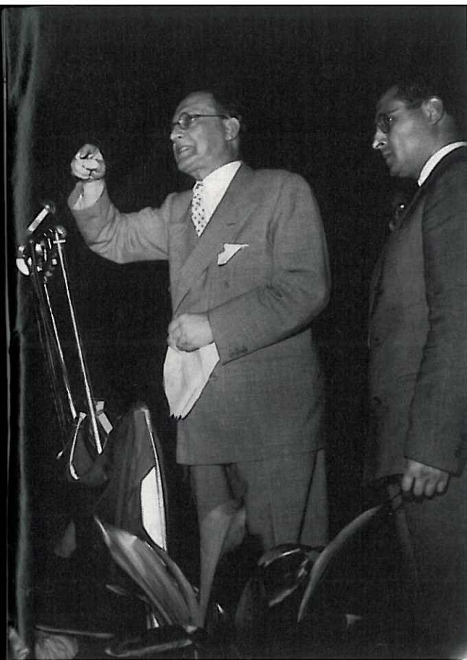
De Gasperi in comizio a Matera su invito di Ambrico (accanto nella foto). Nelle altre due foto due scorci di Grassano e dei suoi abitanti, agli inizi degli anni Cinquanta.